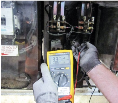
Messungen direkt vor Ort.