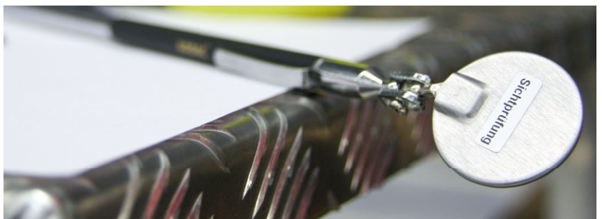
Sorgfältiges Arbeiten sichert reibungslosen Zugbetrieb.

Mit SMARTservices haben wir für Sie ein Standard-Leistungspaket zusammengestellt, das sich an Ihren Bedürfnissen und Ansprüchen orientiert. Sprechen Sie uns an.