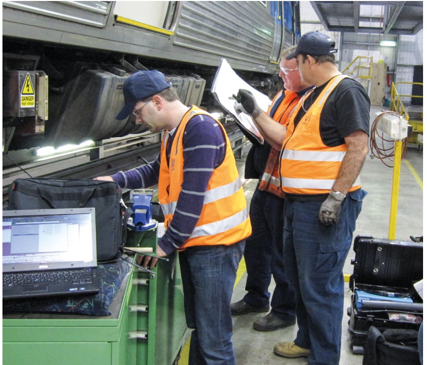
SMARTservices garantiert fachliche Unterstützung, um Ausfallzeiten zu vermeiden.

Zugbetrieb zu gewährleisten. Mit Blick auf den zu vermeidenden Zugstillstand tragen wir dazu bei, die Lebenszykluskosten des Fahrzeugs zu senken. Wir unterstützen Sie bei der präventiven Wartung oder Überholung. Auch hier bieten wir Ihnen fachliche Hilfe in Form von Datenanalysen, um Störanfälligkeiten zu erkennen und vorausschauend zu vermeiden.