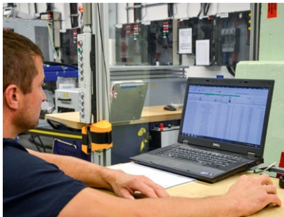
Tests im hauseigenen Prüffeld.